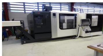
Bearbeitungszentrum mit Palettenwechsler